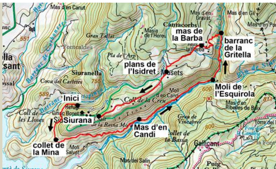
Base cartogràfica: ICC esc. 1:50.000